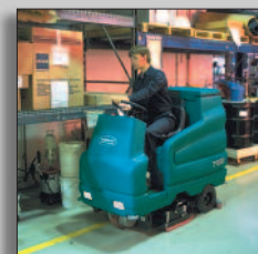
Machine en action