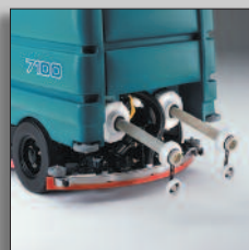
Tuyau de vidange pratique