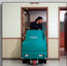
Nettoie près des portes