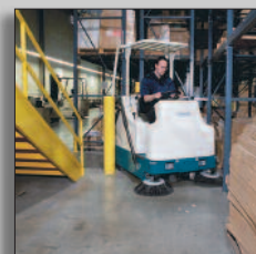
Machine en action