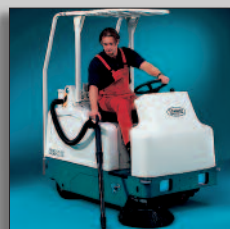
Pare-chocs avant et flexible auxiliaire d'aspiration