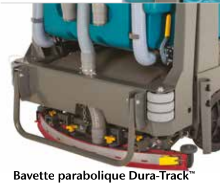
Bavette parabolique Dura-Track™