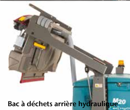
Bac à déchets arrière hydraulique