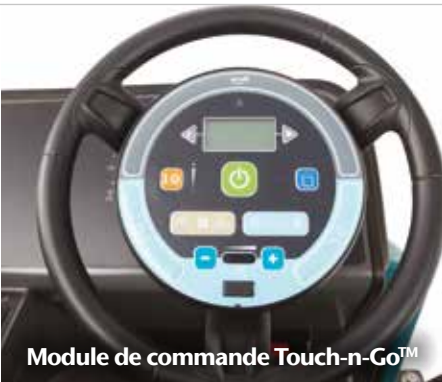
Module de commande Touch-n-Go™