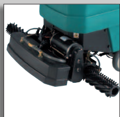
Les brosses de la 1610 pour nettoyage-rénovation