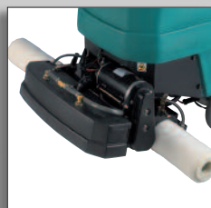
Les rouleaux de la 1610 pour nettoyage d'entretien