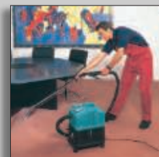
Machine en action