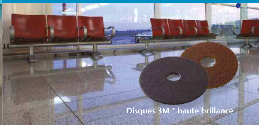
Disques 3M™ haute brillance