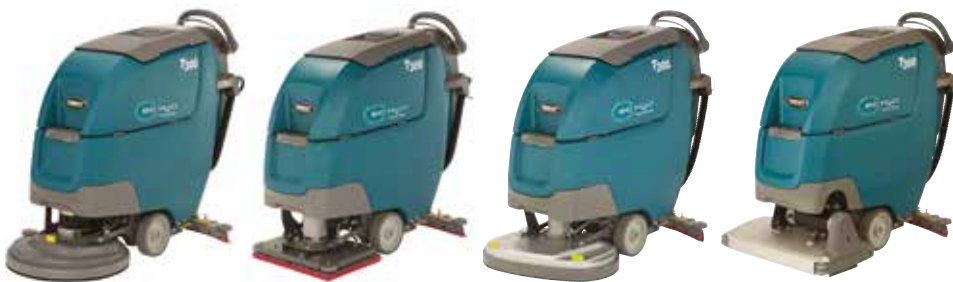
Disque simple : 430 mm et 500 mm

Les autolaveuses T300 sont équipées de multiples types de tête afin de s'adapter à vos besoins de nettoyage et d'optimiser les performances de nettoyage.